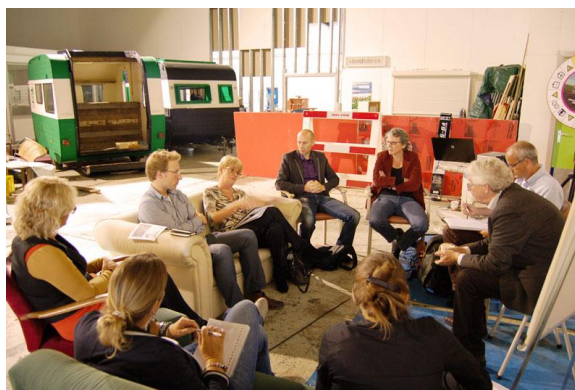
Sessie tijdens het Flexival 2012.