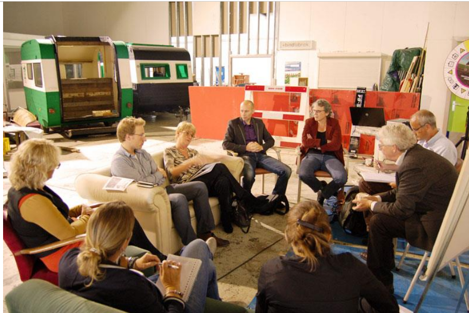
Sessie tijdens het Flexival 2012.

Het CROW heeft een richtlijn opgesteld om grondwerkzaamheden met een beperkte omvang veilig te laten plaatsvinden. Een stroomschema laat zien hoe stapsgewijs het nog veilig te hanteren talud kan worden bepaald op basis van grondwaterstand, de bodemsamenstelling, de tijdsduur van de ontgraving en omgevingsfactoren.