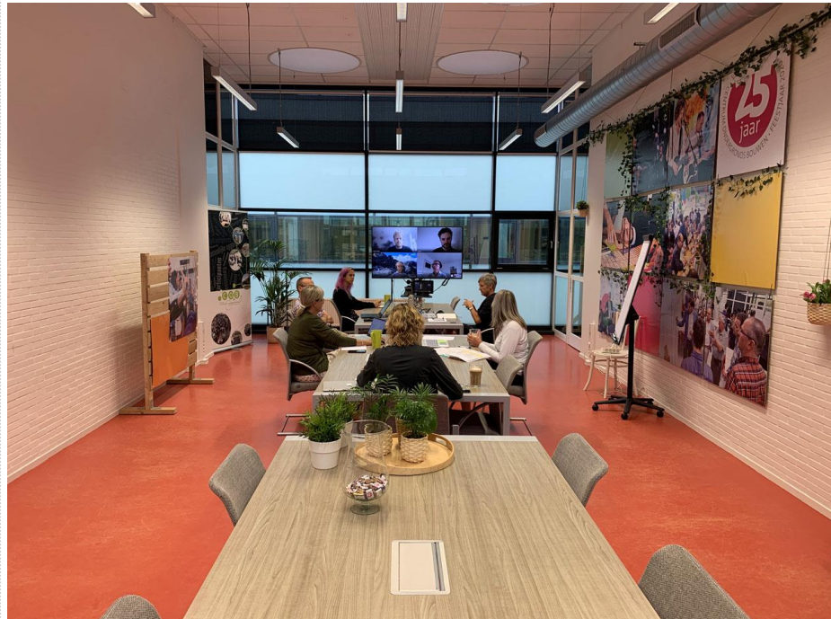
De nieuwe zaal Gruis biedt alle ruimte voor veilige bijeenkomsten.

Samen met het GPKL, de VNG en Stichting Mijnaansluiting is een programma samengesteld over 'strategisch programmeren en adaptief plannen'. Het doel is best practices te vertalen naar 'common practices', zodat de sector gesteld staat de komende uitdagingen zo gestroomlijnd mogelijk aan te pakken.